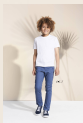
ORGANIC KIDS 11978