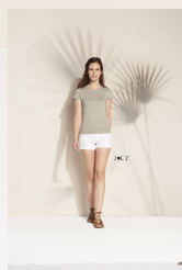
ORGANIC WOMEN 11990